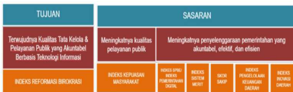
Gambar 1.1 Kerangka Logis Misi 3 RPJMD Kabupaten Blitar Tahun 2025-2029