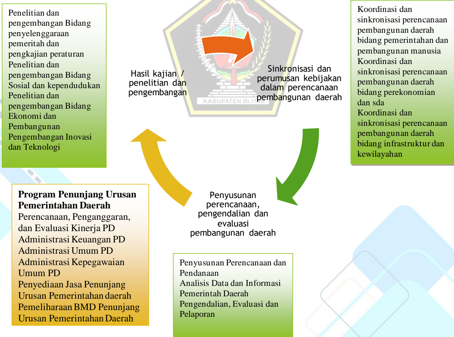
Gambar 4.1. Proses Bisnis Perencanaan

Sesuai tugas pokok dan fungsinya sebagai unsur pelaksana fungsi penunjang daerah dibidang Perencanaan dan fungsi penunjang daerah dibidang Penelitian dan Pengembangan, Bappedalitbang Kabupaten Blitar mengampu dua urusan pemerintahan daerah yaitu Urusan Penunjang Perencanaan Pembangunan dan Urusan Penunjang Penelitian dan Pengembangan. Dalam menjalankan dua urusan tersebut terdapat proses bisnis yang dilaksanakan yang terbagi menjadi dua yaitu proses bisnis perencanaan dan proses bisnis indeks inovasi daerah seperti yang terdapat dalam gambar 4.1 dan gambar 4.2.